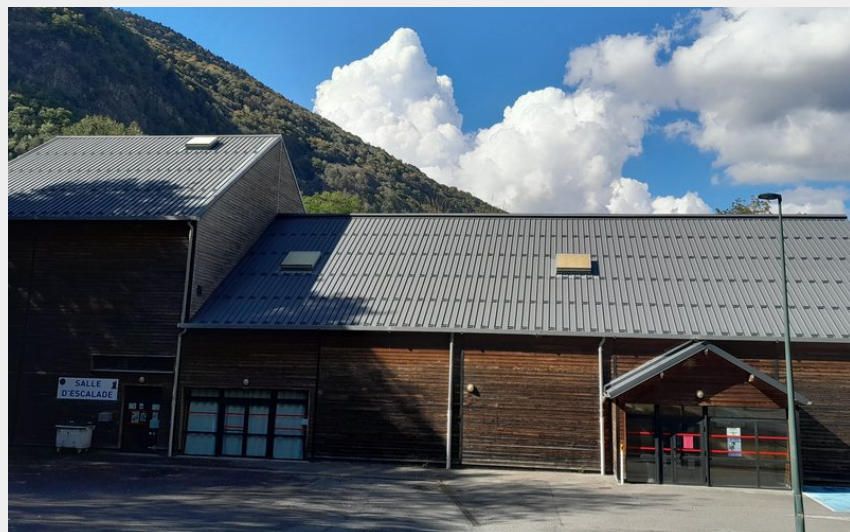
Salle d'escalade Saint Mamet (CR)