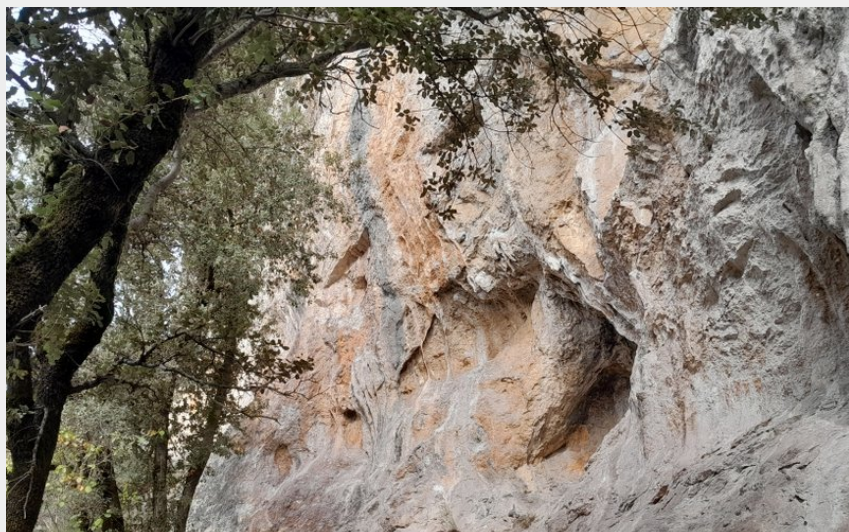
Site d'escalade Ore (CR)