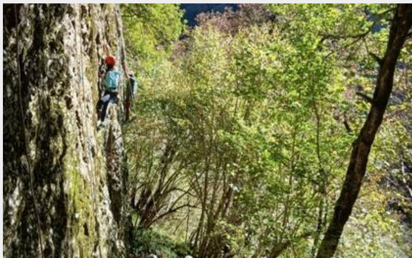
Site d'escalade Vallée du Lys (LHM)