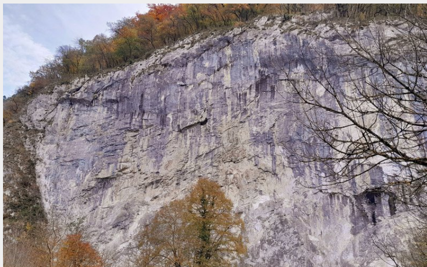
Falaise de Marignac (CR)