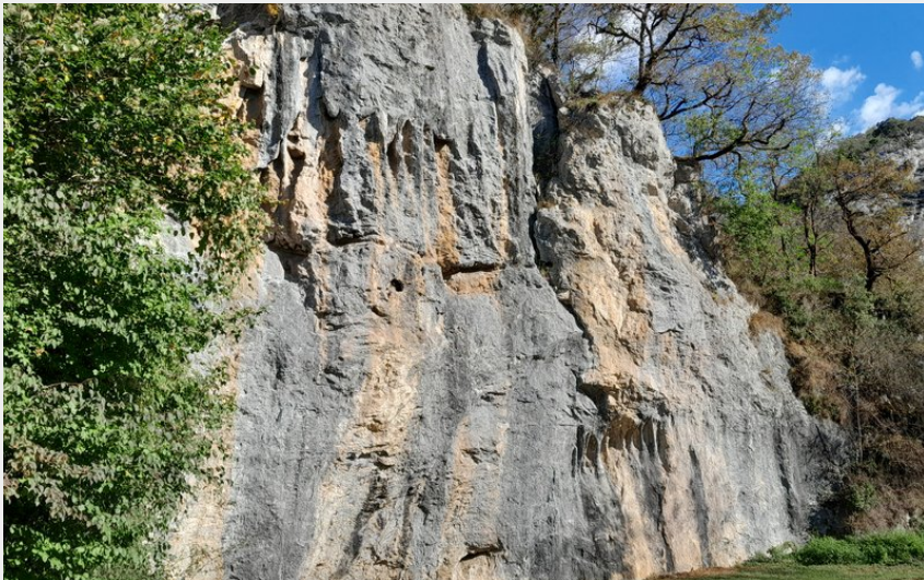
Site escalade Saint Pé d'ardet (CR)