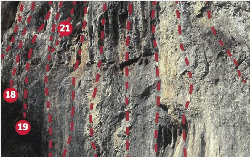
Site d'escalade Saint Pé d'Ardet - Secteur A (CT 31-32 FFME)