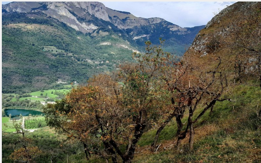
Panorama vers la vallée - CR (CR)