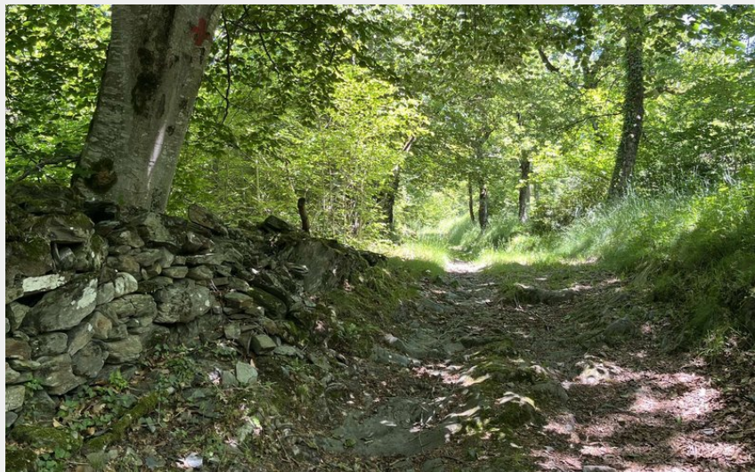
Montée en direction de la chapelle d'Esputs (Alix Ruiperez)