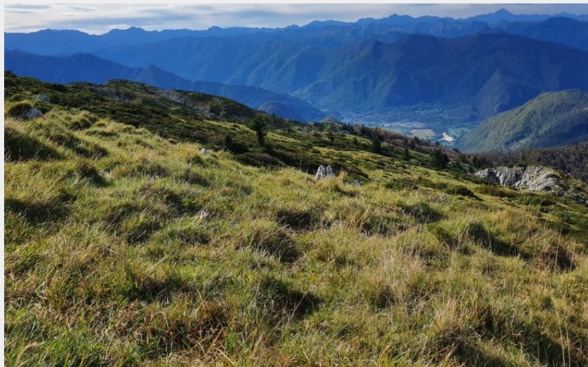
Vue entre le pas de l'âne et le col de l'Escalette (JB)