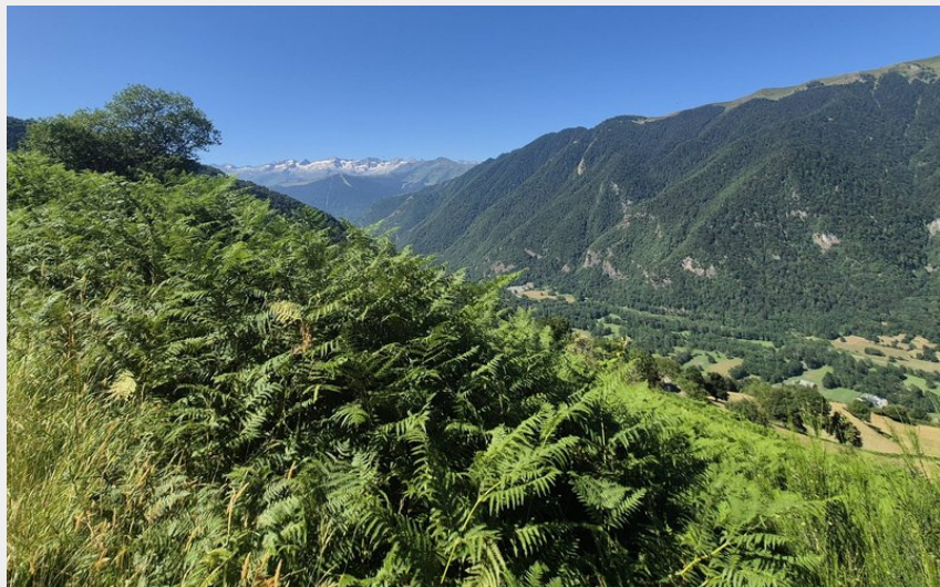
Panorama sur le Luchonnais (JB)