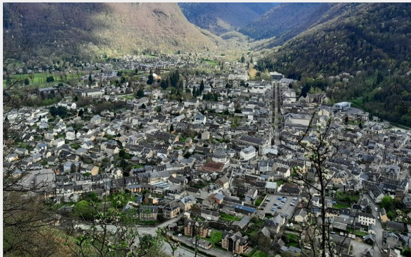
Vue sur Luchon (CR)