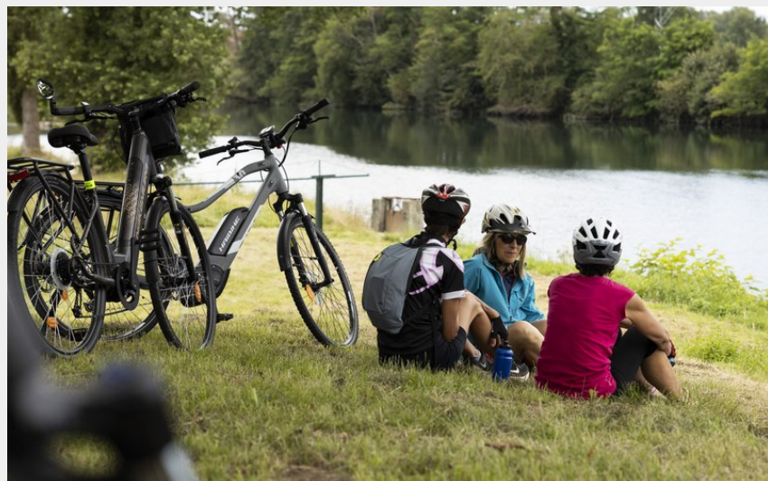
(Baze Production ©CCPHG)