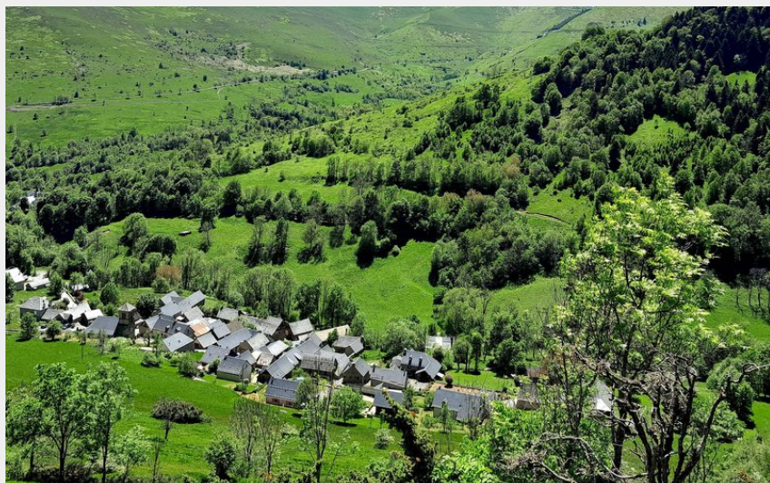
Superbe point de vue sur la Vallée (CR)