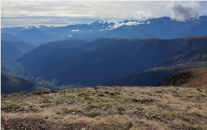
Vue du Mont Né (JB)