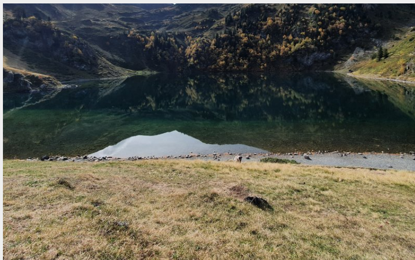
Lac de Bordères (JB)