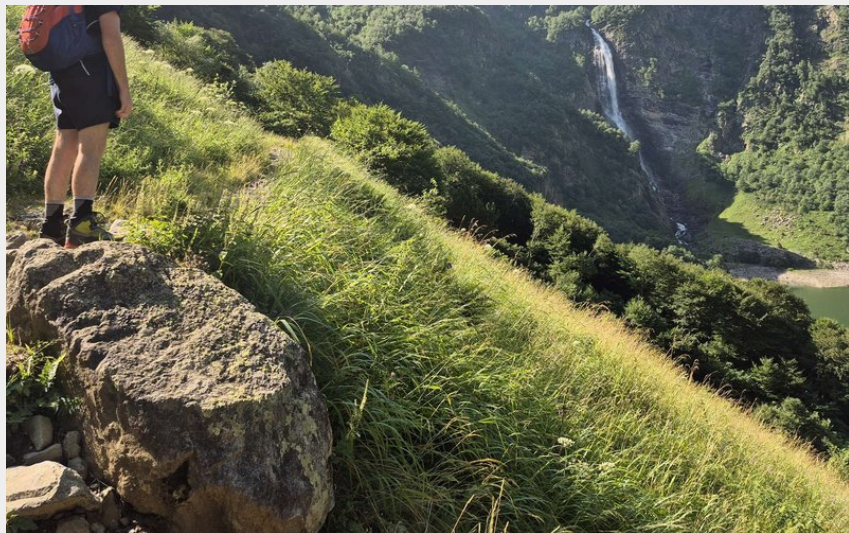
En immersion totale (JB)