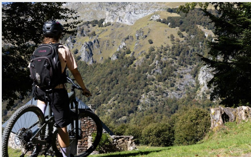
Petite pause avec vue sur l'Escalette