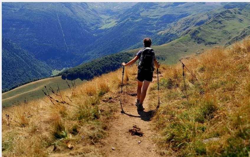
Départ sur les crêtes de Superbagnères (CR)