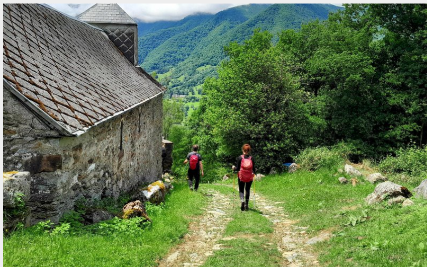
L'arrivée à la Chapelle de Soueste (CR)