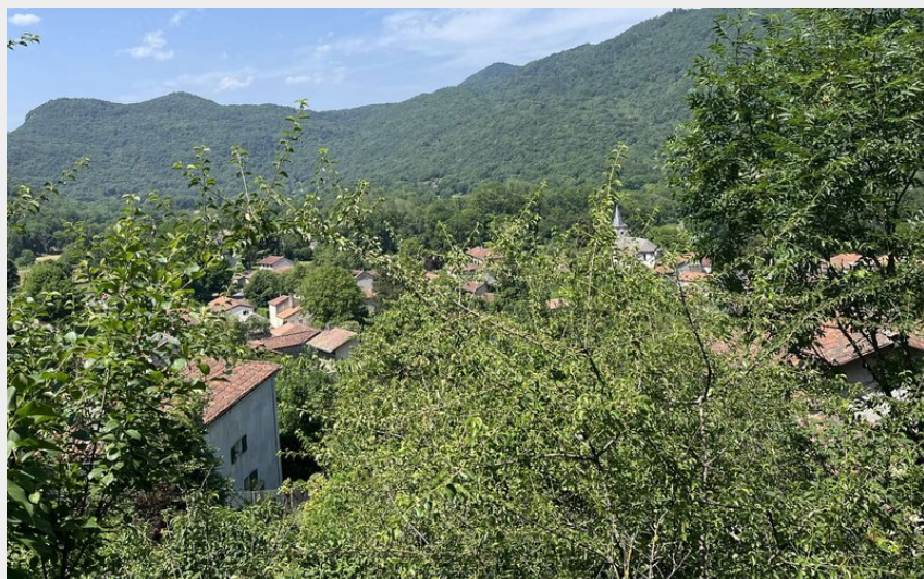
Vue sur les collines d'en face. (Alix Ruiperez)