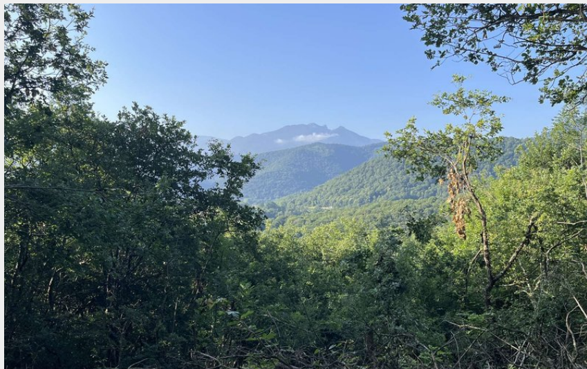
Petite fenêtre paysagère (Alix Ruiperez)