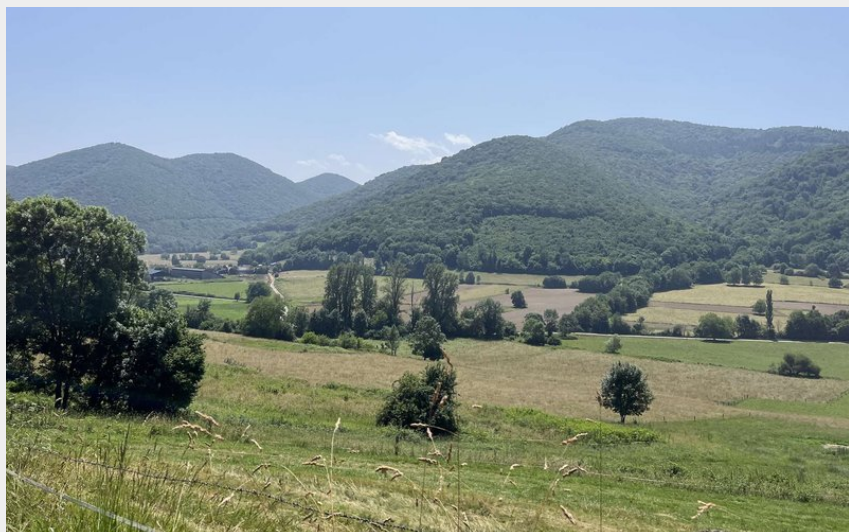
Paysage de la vallée de la Garonne (Alix Ruiperez)