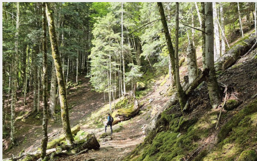
Pause contemplative dans la montée. (JB)