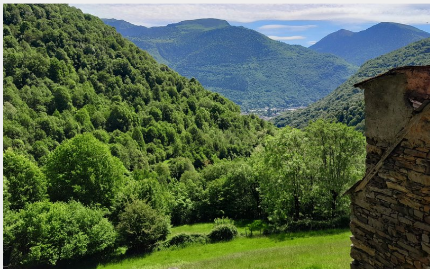
La belle vue des Granges ! (CR)