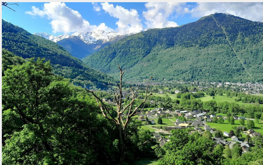
En montée, la jolie vue sur les sommets (CR)