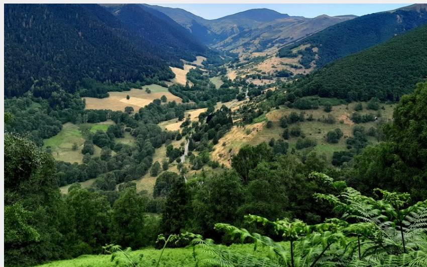
La Vallée d'Oueil (CR)