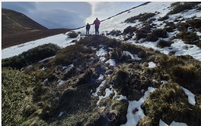
Arrivée sur les crêtes au début du printemps (JB)